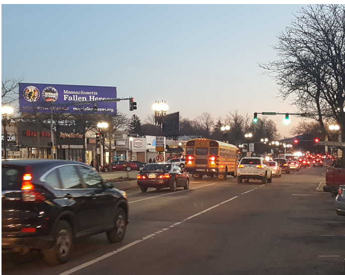
Pi byen jere trafik ak redwi konjesyon nan Mattapan Square