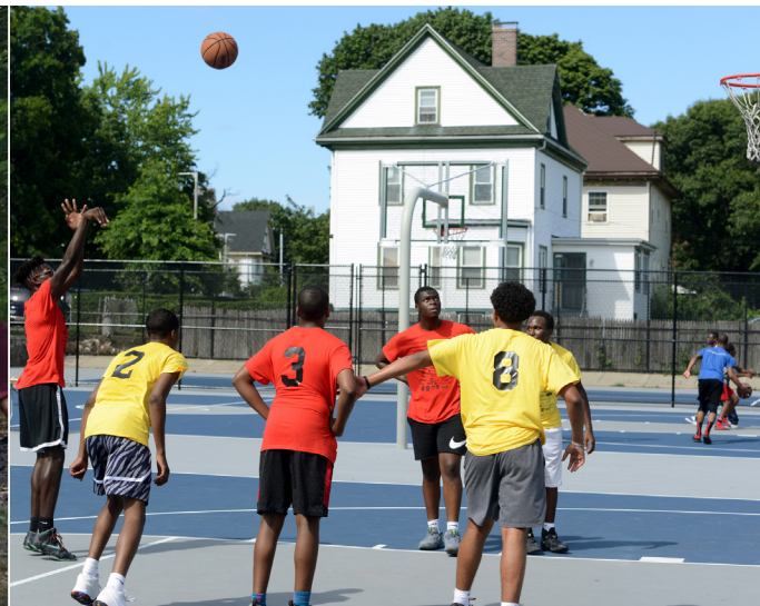
Ogmante pwogram ak lwazi nan espas ouvè yo