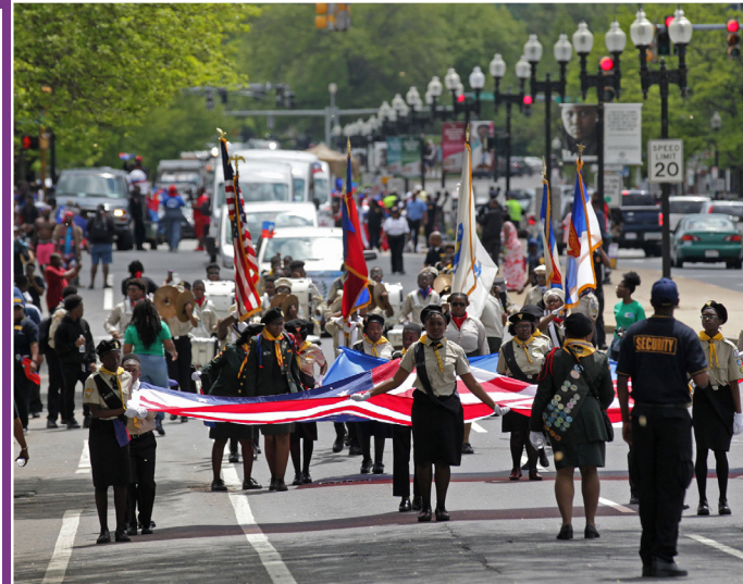
Selebre idantite Mattapan atravè plasman ak ar piblik