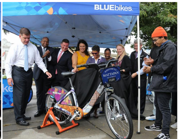
Rann li pi fasil pou deplase nan katye a