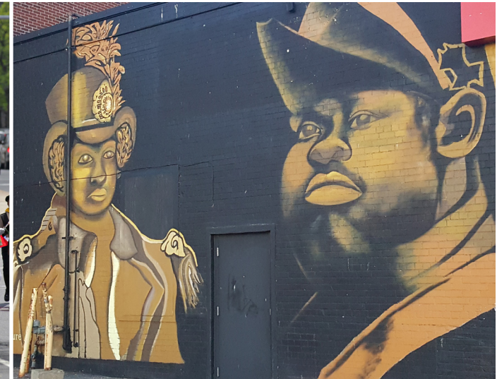
Sipòte atis lokal ak espas atis yo