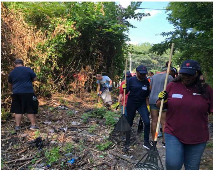
Kreye pi bon aksè pou espas ki ouvè yo