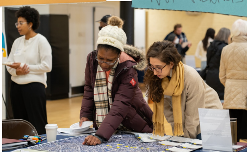
Comentarios de nuestro evento de lanzamiento en Cleary Square